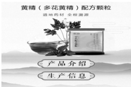
图5 黄精(多花黄精)配方颗粒追溯码展示信息示意图